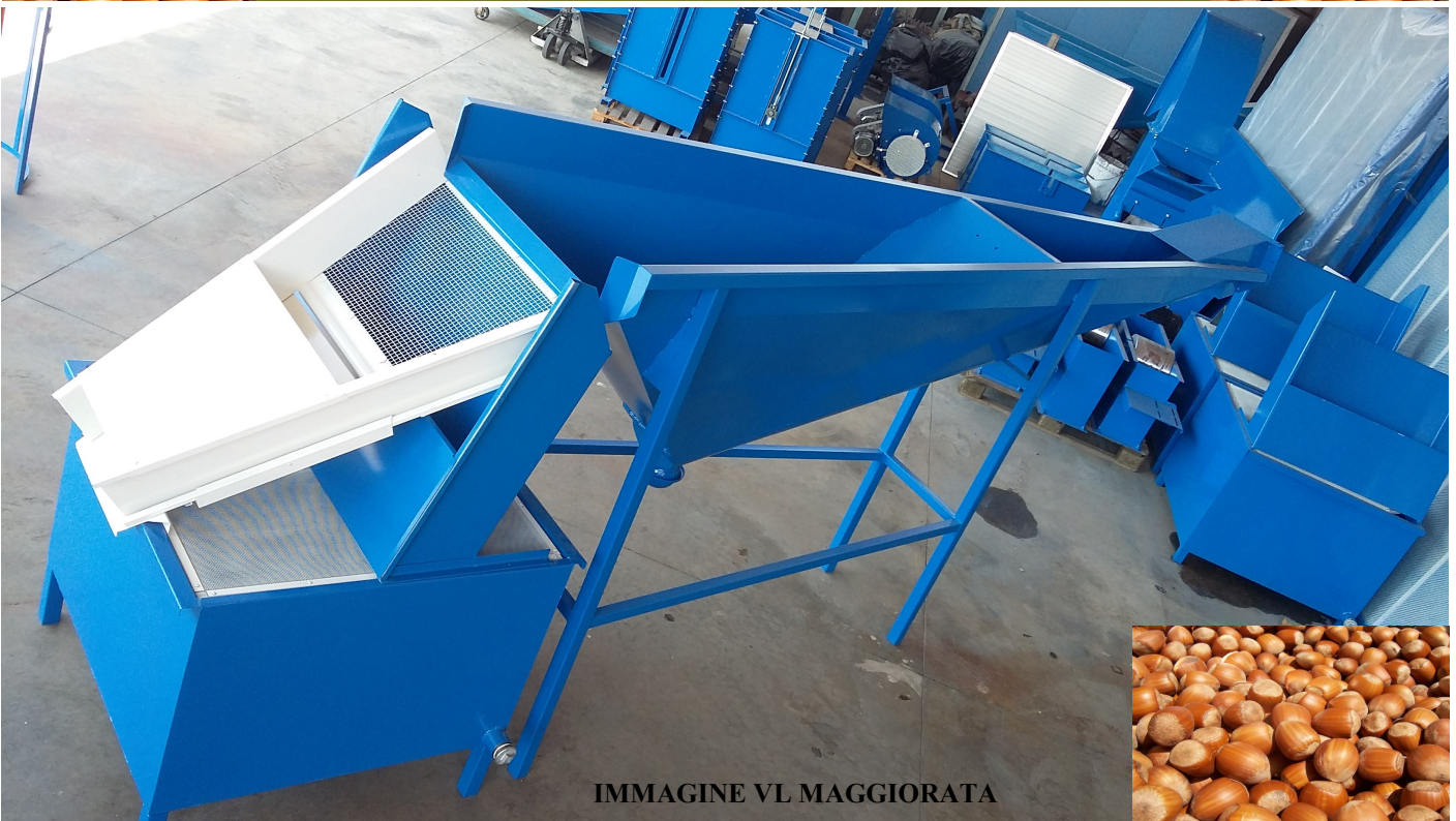
IMMAGINE VL MAGGIORATA