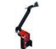
Brazo abatible adicional