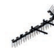
Rastra de puas