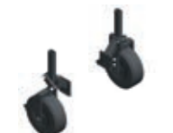
Pareja de ruedas metálicas delanteras