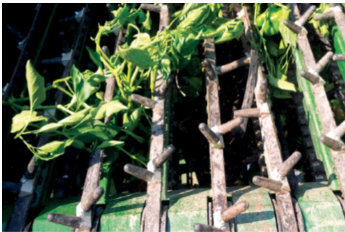
> Detalle sacudidor a cintas