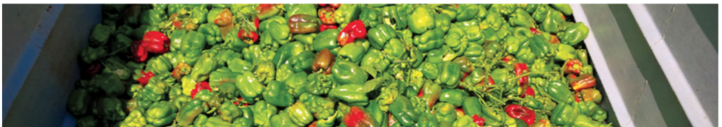
> Producto final